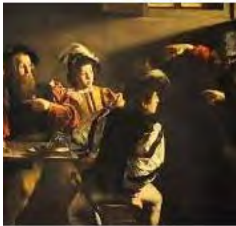
The Calling of Saint Matthew

Caravaggio transformed lighting into a central element of his art, intensifying contrasts and immersing his characters in striking beams of light.