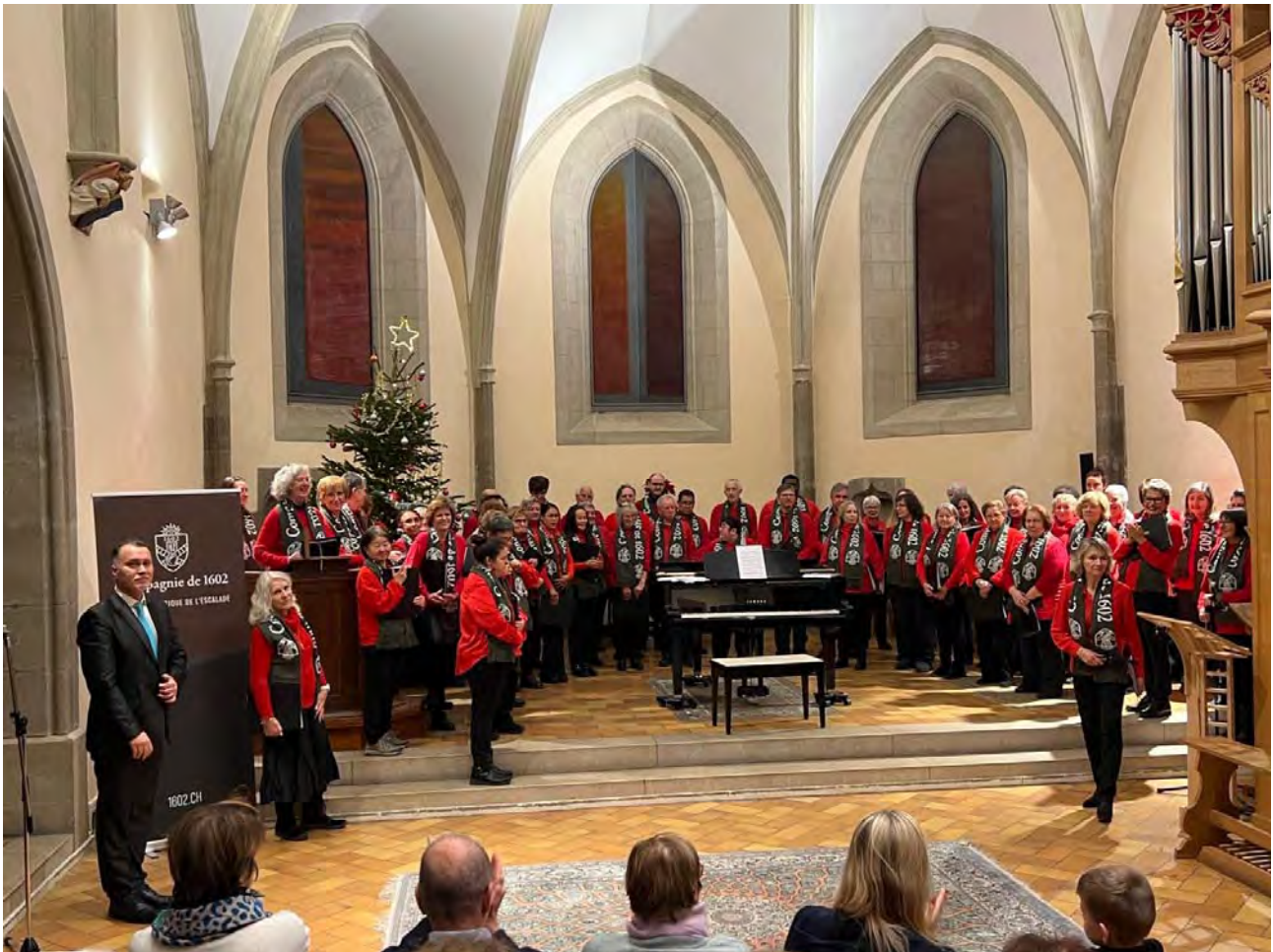
Historic choir at the Auditorium Calvin

Have you heard about the historic singing for the Escalade? I am addressing especially those of our retirees for whom Geneva has become their main or second home. I am sure you have. I am also sure that you have heard it more than once when you took part in the Escalade celebrations.