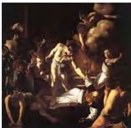
Le martyre de Saint Matthieu

Ces œuvres eurent dès leur installation un grand prestige.