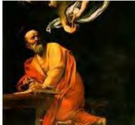
Matthew the Evangelist