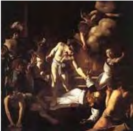
The Martyrdom of Matthew

These works enjoyed great prestige from the moment they were installed.