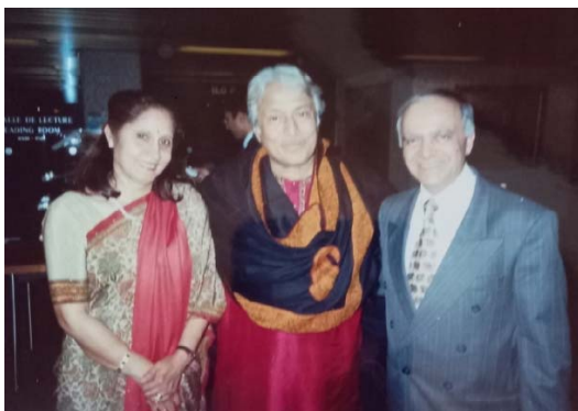
Amjed Ali Khan (joueur de sarod)

Rencontre avec Indira Gandhi et avec Mère Thérèse)